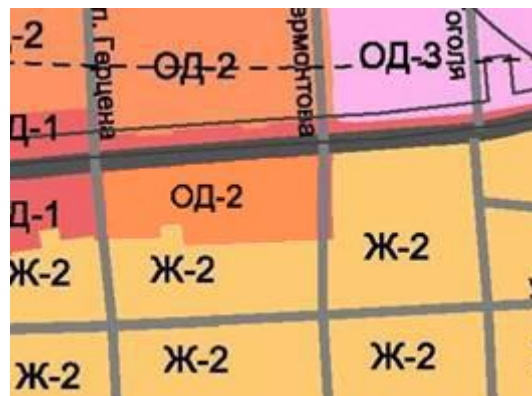
Территориальная зона после внесения изменения в Правила