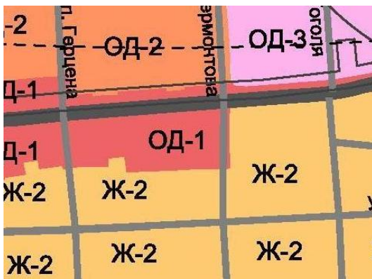
Территориальная зона до внесения изменения в Правила