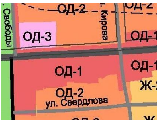
Территориальная зона до внесения изменения в Правила