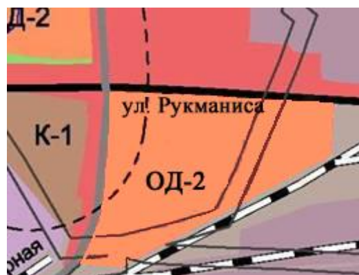
Территориальная зона после внесения изменения в Правила