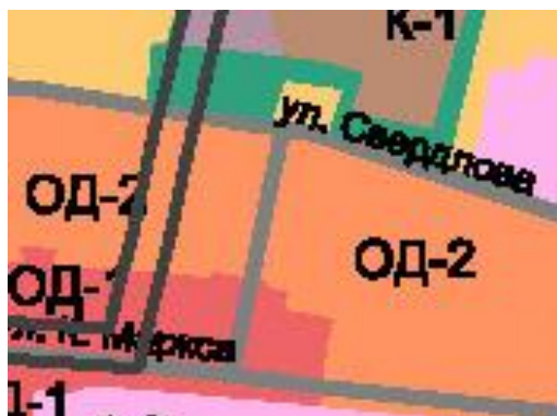
Территориальная зона до внесения изменения в Правила